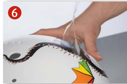
Bild auf die gewünschte Form bei Raumtemperatur auftragen.